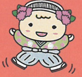
都島区社会福祉協議会 マスコットキャラクター 「みやこりん」